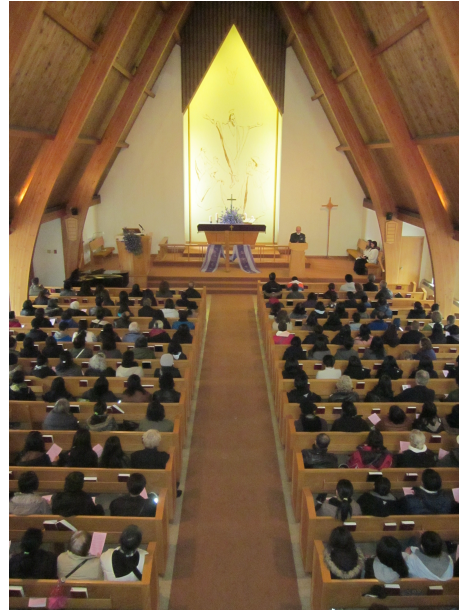
COTH Lieldienu gājiens