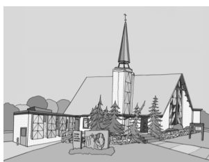
Aldis Sukse 2009