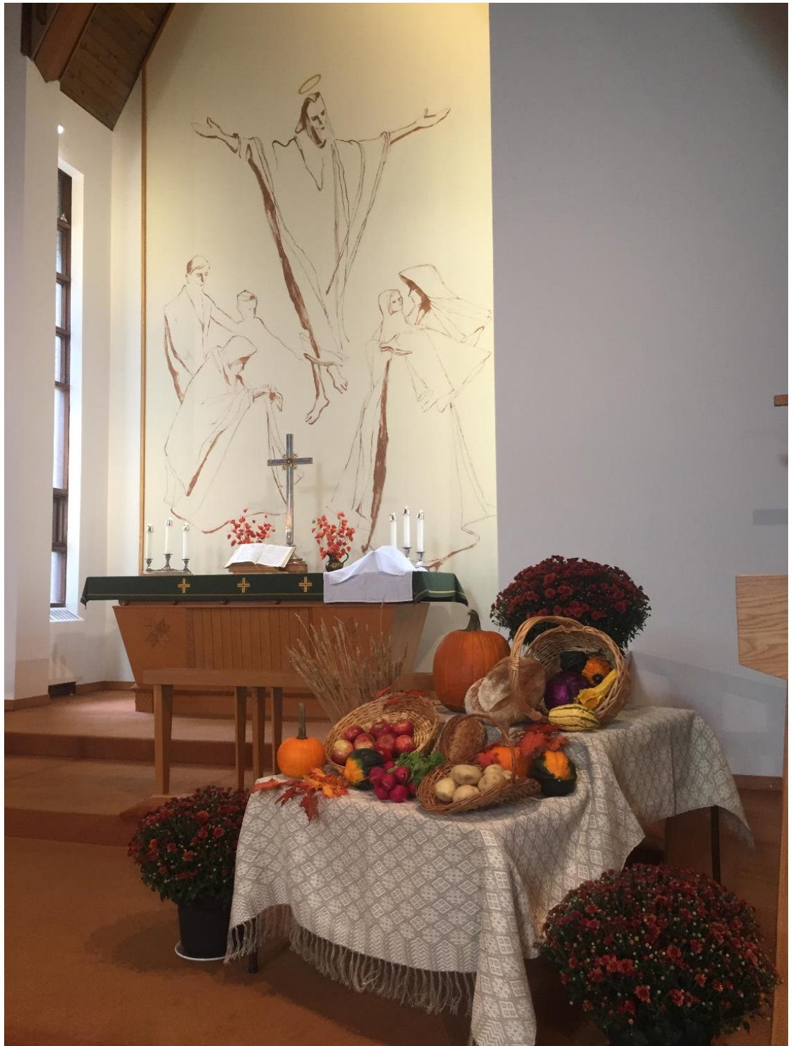
Pļaujas Svētku dabas veltes 6. oktobra dievkalpojumā