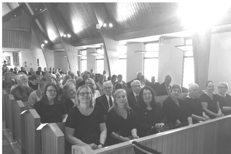
Sv. Jāņa draudzes ansambļa dalībnieki