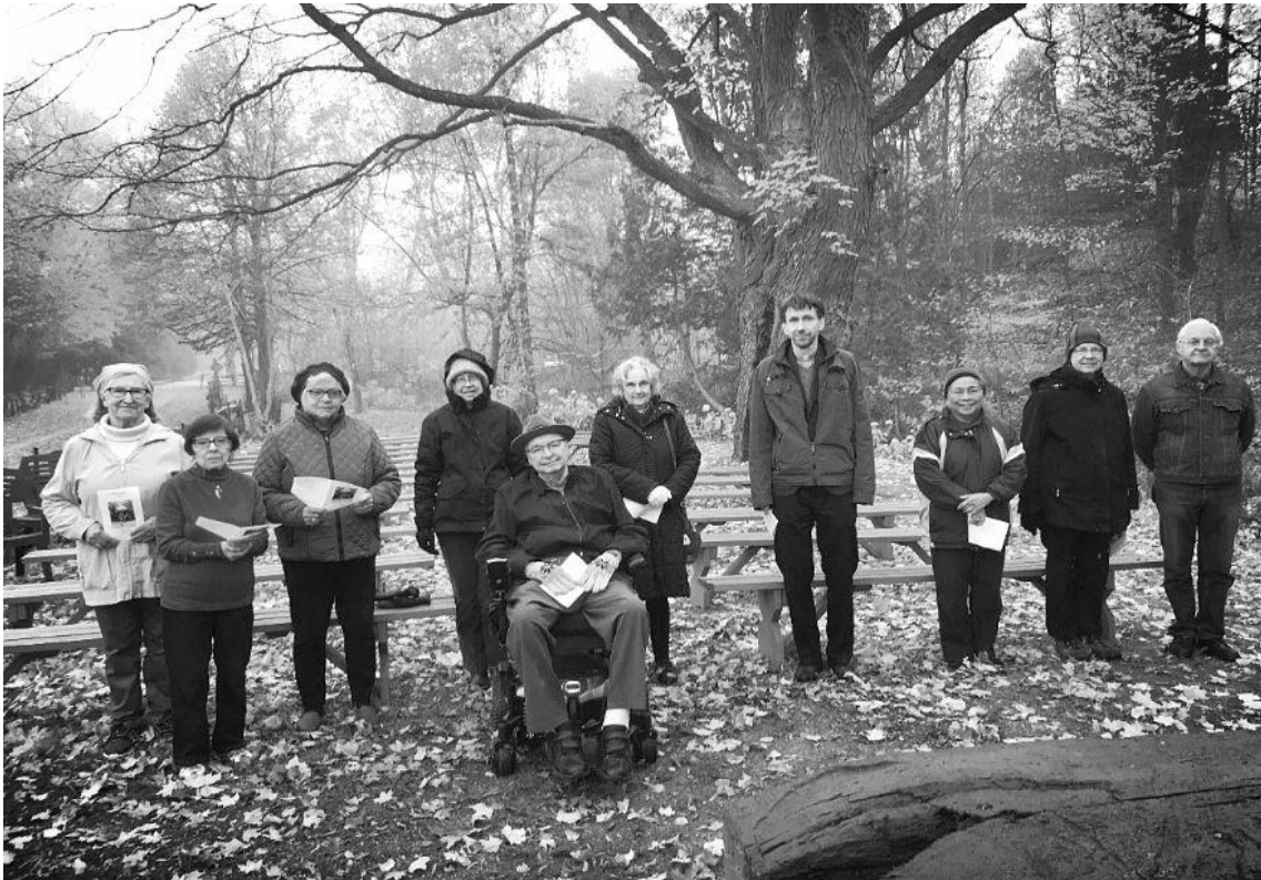
Saulaines retrīta dalībnieki.