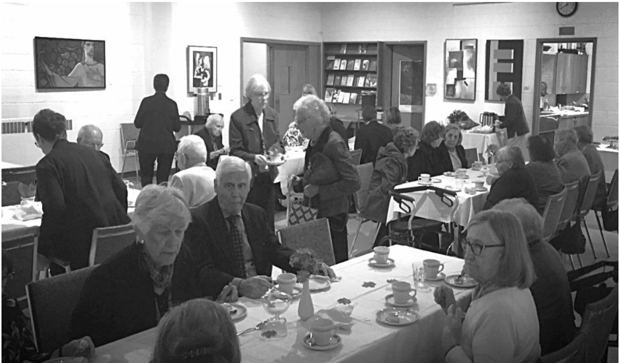
Kopā iz baudām Pļaujas svētku maltīti.